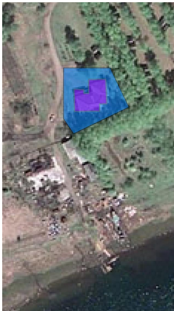
Ситуационная схема территории ОКН